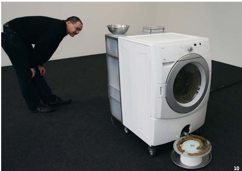
10- Wim Delvoye, "Personal Cloaca", 2007 (installation).

veut, ce qu'il peut. Ici, un éléphant, là, des oreilles ou des asticots ! Le "film d'animation" qui se joue sous nos yeux pourrait aussi bien avoir été réalisé en trois dimensions et l'abstraction a cela de pratique que l'on s'y projette aisément. Et puis il y a le jeu des regards entre celui ou celle dont la pensée semble se matérialiser et ceux qui l'observent. Voit-il ce que je vois ? L'esprit de cette personne n'est-il pas foisonnant ! Peu de temps avant la fin de l'expérience, les artistes proposent aux cobayes volontaires de manipuler ces sculptures animées et, par conséquent, de toucher du doigt quelques pensées du moment, à moins qu'il ne s'agisse des sentiments de peur ou d'obsession ancrés plus profondément.