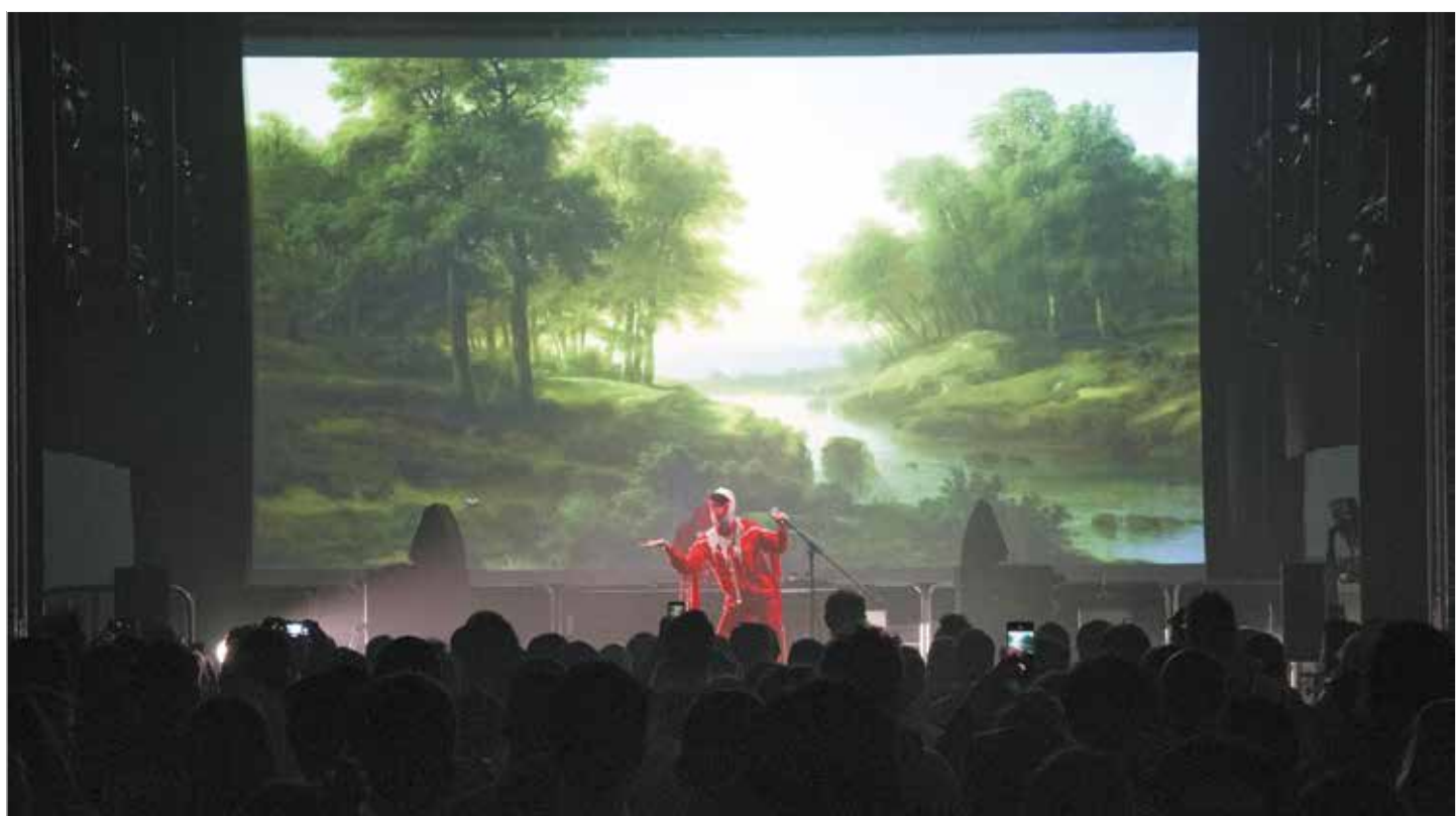
Gazelle Twin, au Festival LEV 2019, Album Pastoral

Il n'est pas rare, pour des spectateurs et festivaliers qui viennent d'assister à un spectacle numérique, d'avoir une impression de déjà-vu. Les œuvres d'aujourd'hui, réalisées à partir d'outils numériques, sont-elles réellement identiques sur le fond et la forme ? Quelles sont les variables qui contribuent à un phénomène d'uniformisation et au contraire quelles sont celles qui favorisent la sauvegarde de la singularité des œuvres numériques ?