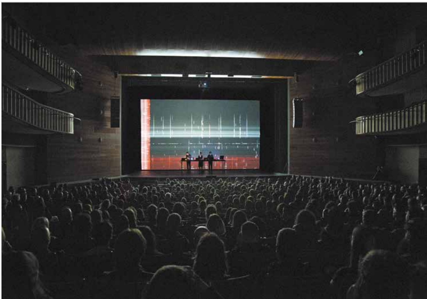
ScanAudience de Schnitt + Gianluca Sibaldi, Festival LEV 2019