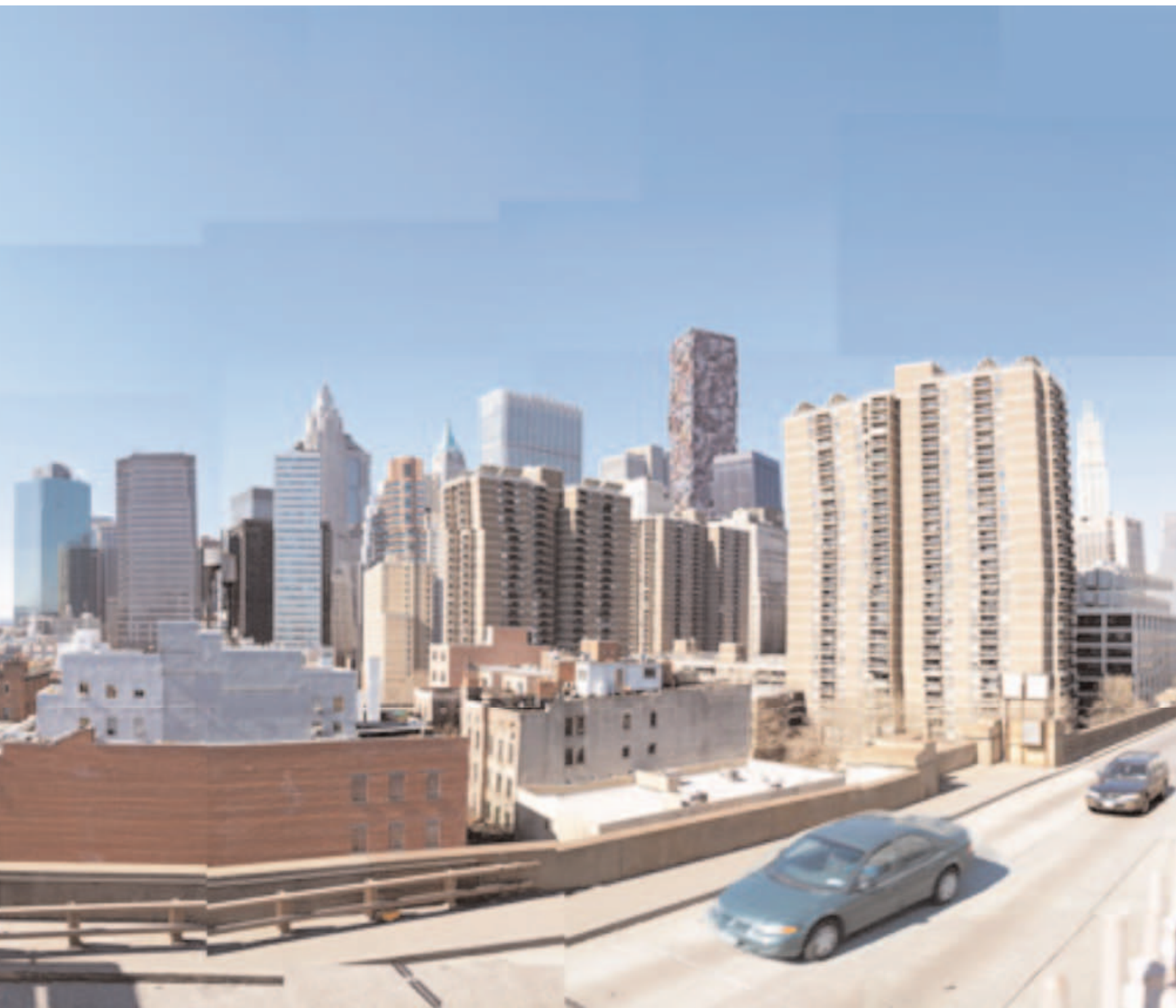
New York, Brooklyn Bridge, 2005 (photographie contrecollée sur aluminium, encadrement, 100 x 140 cm)