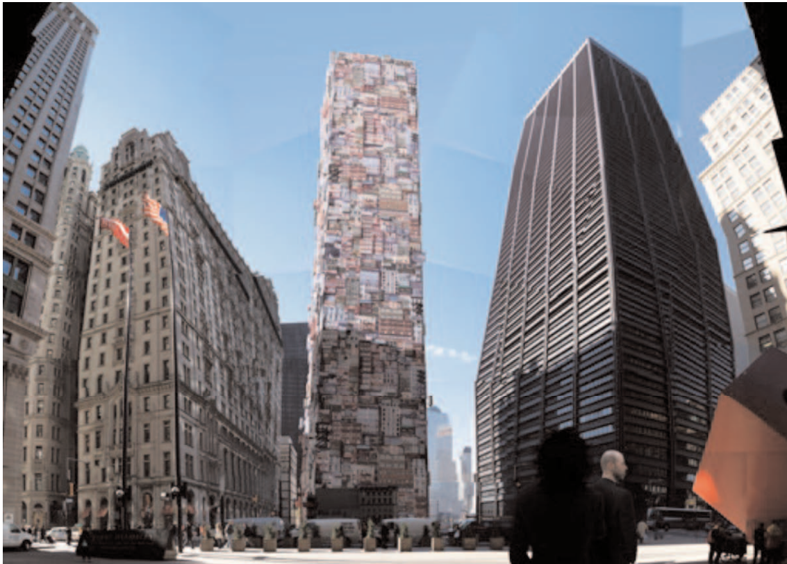
New York, Ground Zero, 2005 (photographie contrecollée sur aluminium, encadrement, 100 x 140 cm)