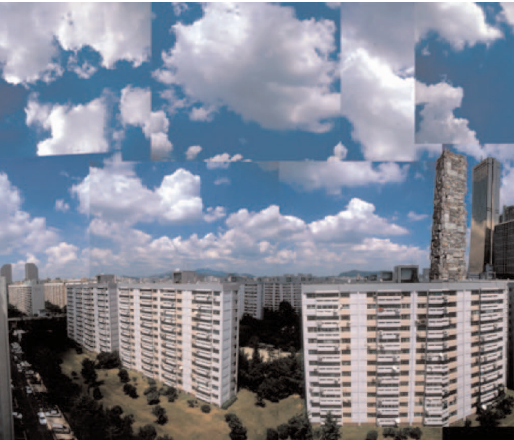
Séoul, Yoido, 2005 (photographie contrecollée sur aluminium, encadrement, 100 x 140 cm)