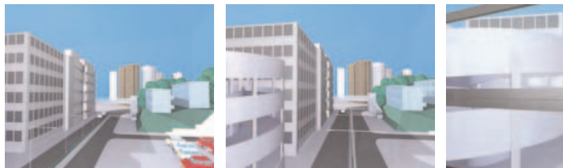
Film de vacances, Hong-Kong, 2003 (vidéo)

LES RECHERCHES DU COLLECTIF KOLKOZ, FONDÉ IL Y A UNE DIZAINE D'ANNÉE PAR SAMUEL BOUTRUCHE ET BENJAMIN MOREAU, S'EXPRIMENT SOUS DE MULTIPLES FORMES : DE LA PHOTOGRAPHIE AU DESSIN, DE L'INSTALLATION À LA PERFORMANCE, DU JEU VIDÉO À L'ANIMATION. IL EST DANS LEUR TRAVAIL QUELQUES NOTIONS CLÉS, COMME L'HYBRIDATION OU LA RECONSTITUTION, QUI PARTICIPENT D'UNE DÉMARCHE ARTISTIQUE RÉSOLUMENT CONTEMPORAINE.