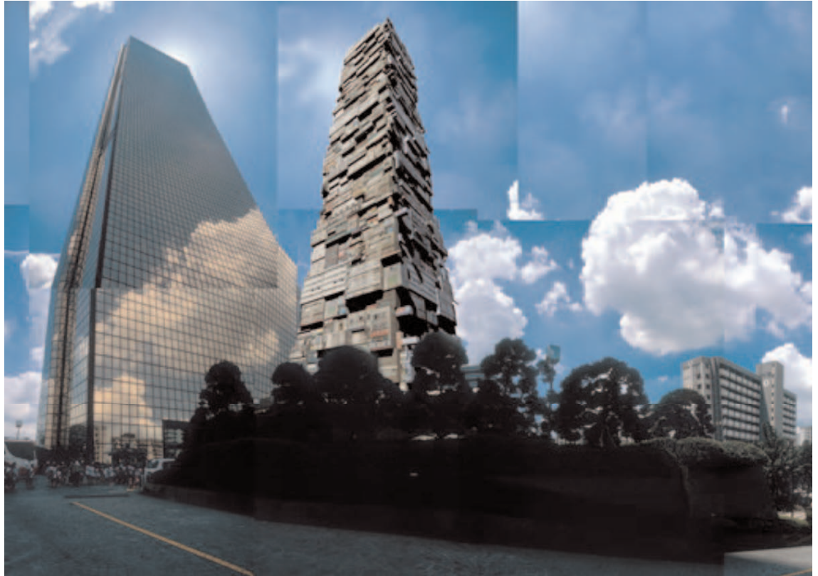
Séoul, 63 Building, 2005 (photographie contrecollée sur aluminium, encadrement, 100 x 140 cm)